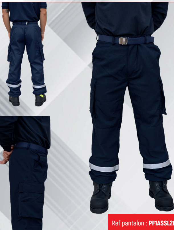
Ref pantalon : PFIASSL2POBLBG

⚡ NF EN ISO 13688:2013+A1:2020 ⚡ ISO 11612:2015:A1,B1,C1 ⚡ NF EN ISO 1149-5:2018 - ZONE ATEX 1, 2, 20, 21, 22